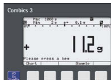
Menu principale con tasti funzione assegnati dall'utente