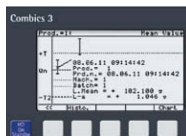
Sono sempre disponibili informazioni dettagliate sui lotti in corso.